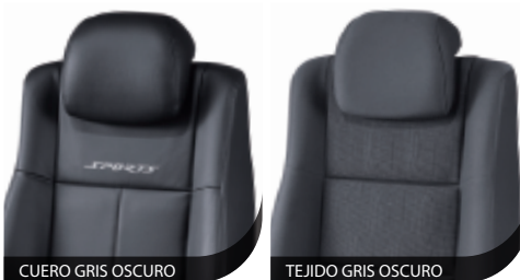
CUERO GRIS OSCURO