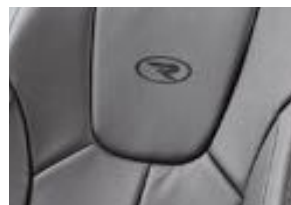
Cuero Deluxe Negro