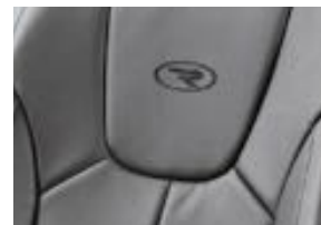
Cuero Deluxe Negro