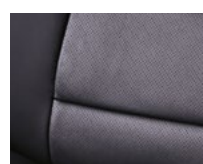
Cuero Gris Oscuro